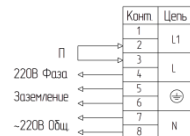
Рисунок 1. Схема подключения светильника